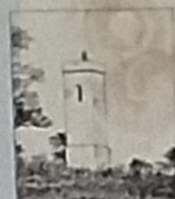
Fazenda do Porto de Bolama

As profundidades foram levantadas com o uso de sondas mecânicas e eletrônicas, sendo as profundidades eletrônicas verificadas com o uso de sondas mecânicas.