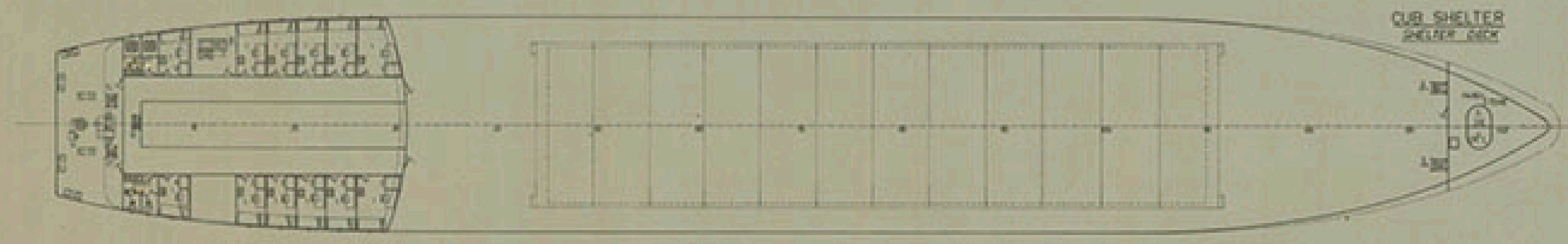
CUB. SHELTER SHELTER DECK