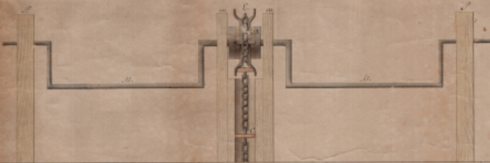
Fig. a 1. a